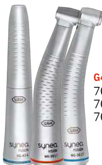
G440 700 WG-56 LT 700 WG-99 LT 700 HG-43 A