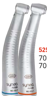
5257 700 WG-56 LT 700 WG-99 LT