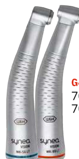
G441 700 WK-56 LT 700 WK-99 LT