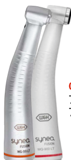
G439 700 WG-99 LT 700 WG-900 LT