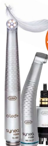
F415 700 TG-98 L 700 RQ-24 700 WG-56 LT