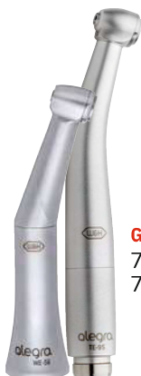
G443 700 TE-95 700 WE-56