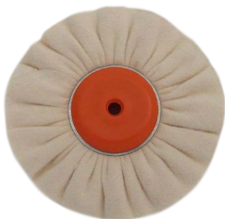
● REF: 019 900 372 168F 100 (49) Nabíraný leštící kartáč, jemný