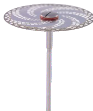
● REF: 804 104 990 524 400 (7465) Separační disk na sádru, síla 0,37 mm/O 45 mm