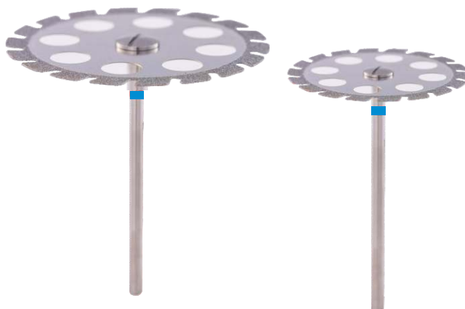
● REF: 806 104 378 524 450 (7569) Separační disk na sádru, síla 0,25 mm/O 45 mm