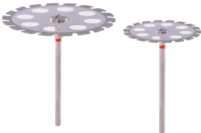
● REF: 806 104 378 514 450 (7567) Separační disk na sádru, síla 0,15 mm/O 45 mm